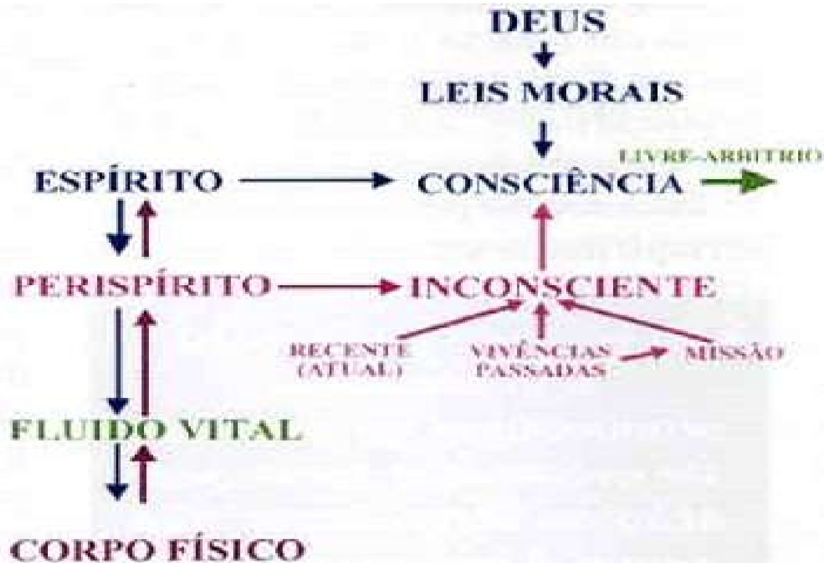
FIG.2: O "VOCÊ DECIDE" DO ESPÍRITO

Decisão do Espírito, no uso de seu livre arbítrio, sob influência das ações encaminhadas pelo corpo físico, pelo inconsciente, e pelas Leis Morais impressas na sua consciência